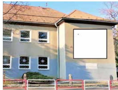
Fotografia hore: Miesto na nový mural.