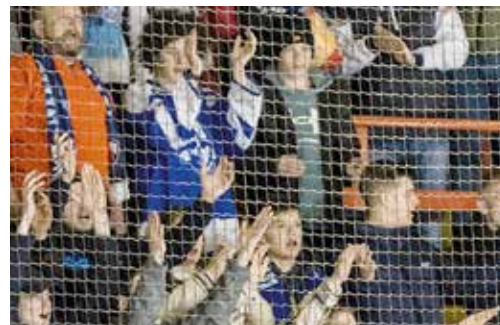
Fotografia vľavo: Oprávnená radosť, Martinčania na jednotku zvládli semifinále so Skalicom.