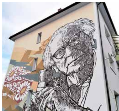
Známy priateľ Slovákov Karol Plicka, muž deviatich remesiel.