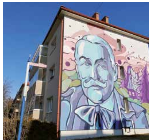
Pavol Országh Hviezdoslav na Hviezdoslavovovej ulici v Martine.