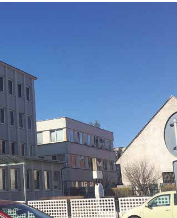
Sídlo Turčianskej vodárenskej spoločnosti v Martine.

nosti v hospodárstve vyzval ÚRSO, druhou má byť na jeseň návrh ceny na nové regulačné obdobie," hovorí R. Zábronský.