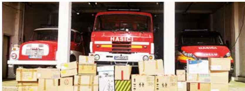
Pomoc, ktorá z Priekopy mierila na Ukrajinu.