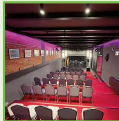
Divadlo Deep na martinskej Ľadovni.