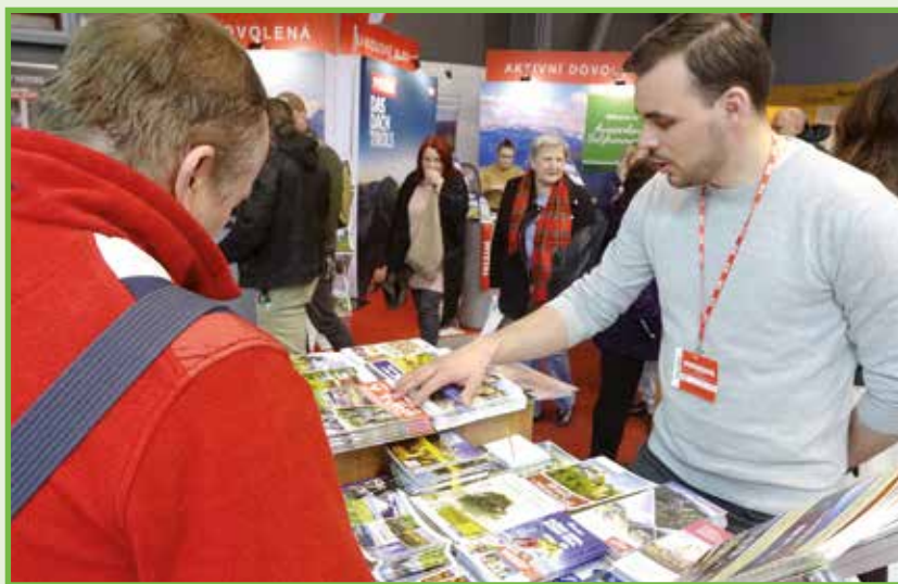
Región Turca bol prezentovaný na výstave cestovného ruchu v Prahe.

Okrem prírodných krás, možností turistiky a cykloturistiky ich zaujímalo, aké máme v Turci ďalšie atrakcie, vodné plochy či akvaparky. Pýtali sa i na rôzne možnosti ubytovania. Mnohí českí občania trávia dovolenky na Slovensku často, iní sa k nám chystajú prvý raz. Tých sme zásobili dostatočným množstvom informácií a tipov, ako si čo najlepšie vychutnať Turiec. Ján Farský