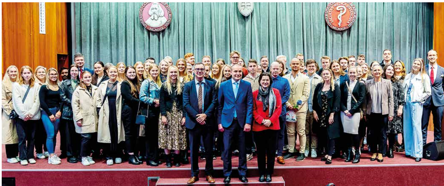
Prezident G. Th. Jóhannesson s islandskými študentmi medicíny.

Na Jesseniovej lekárskej fakulte v Martine študuje medicínu 171 študentov z Islandu. Časť svojej návštevy na Slovensku im v piatok 28. októbra vyhradil aj islandský prezident Gudni Thorlacius Jóhannesson.