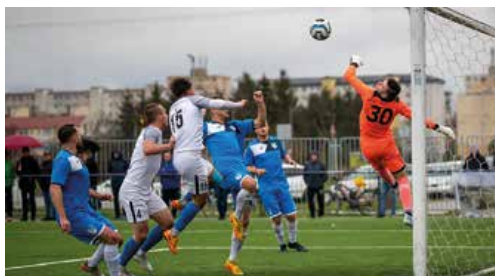
Občas bolo pred našou bránou rušno, ale favorit sa gólovo nepresadil.

A hráči Beluše túto úlohu potvrdzovali aj na ihrisku. Mali o čosi viac z hry, častejšie držali loptu na svojich kopačkách, no Turčania na druhej strane pozorne bránili, dobre vykrývali priestory