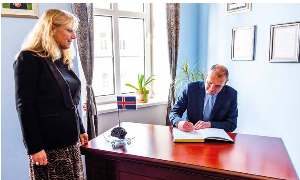
Na islandskom konzuláte v Martine.