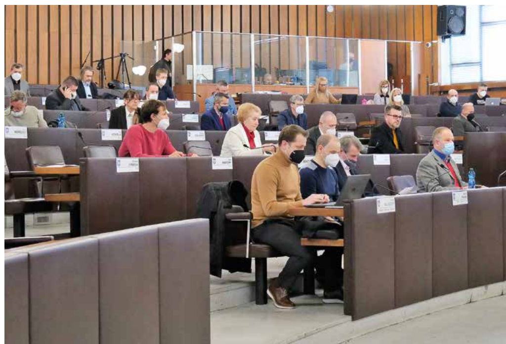
Voliči výrazne zmenili zloženie mestského zastupiteľstva.

Najvyššiu dôveru z hľadiska získaných percent vo svojom obvode od voličov získali Zuzana