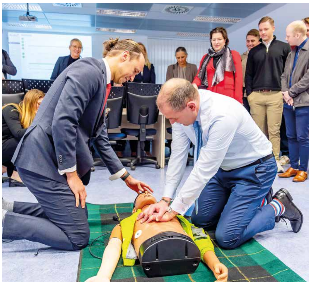
Prezident G. Th. Jóhannesson si na figuríne vyskúšal, ako možno poskytnúť prvú pomoc.

„Na Islande nedokážeme vzdelávať všetkých študentov, ktorých potom potrebujeme v praxi nášho zdravotníctva. Preto sme museli hľadať spôsob a miesto, ako túto našu potrebu naplniť. Ako počúvam, naši študenti sú spokojní s tým, ako slovenské lekárske fakulty vychovávajú a vzdelávajú budúcich lekárov. U nás potom bez problémov dostanú lekárske licencie,