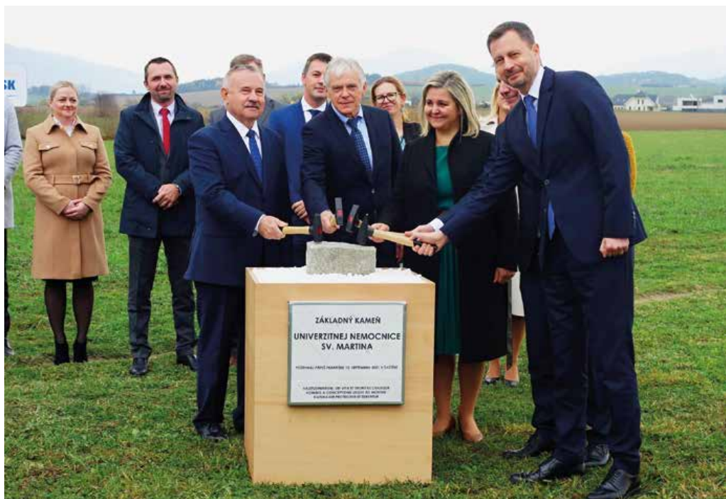
Základný kameň novej nemocnice bol slávnostne poklepaný, stavať sa začne v budúcom roku.