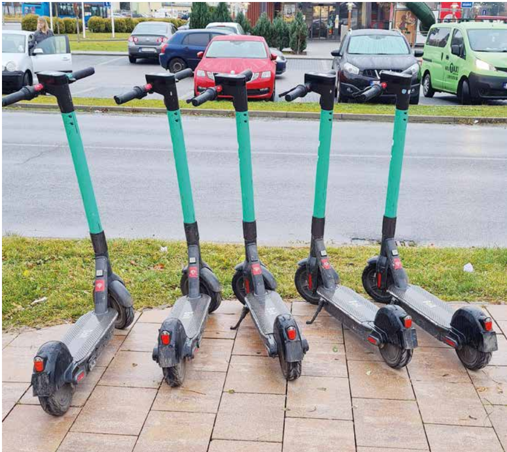
Kolobežky sa stali už súčasťou dopravy po našom meste.

Kolobežky a cyklisti v pešej zóne, zvýšený pohyb ľudí pred cintorínmi a reflexné prvky ako téma týchto dní a prevencia pred dopravnými kolíziami. Aj o tom hovoríme so Sebastianom Andrášikom z martinskej mestskej polície.