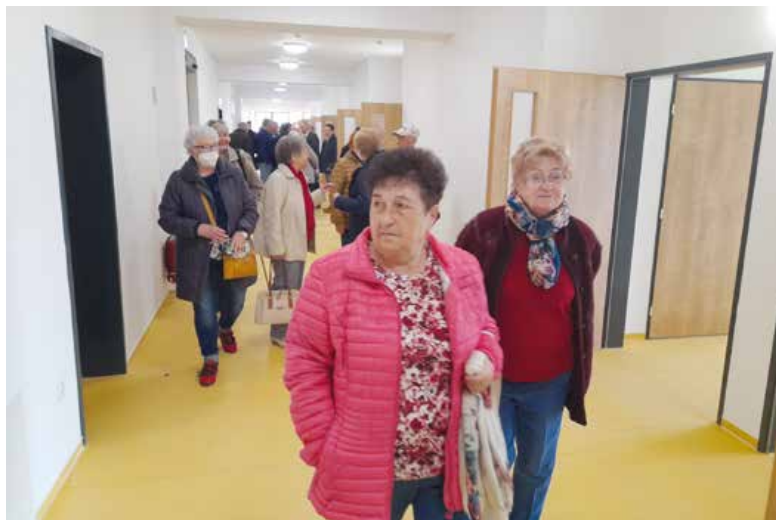
Centrum si prišla v deň otvorenia pozrieť viac ako stovka ľudí.