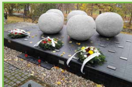
Národný pamätník olympionikov.