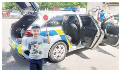
Priekopský MDD ponúkol veľa atrakcií, aj policajné auto s novými farbami.