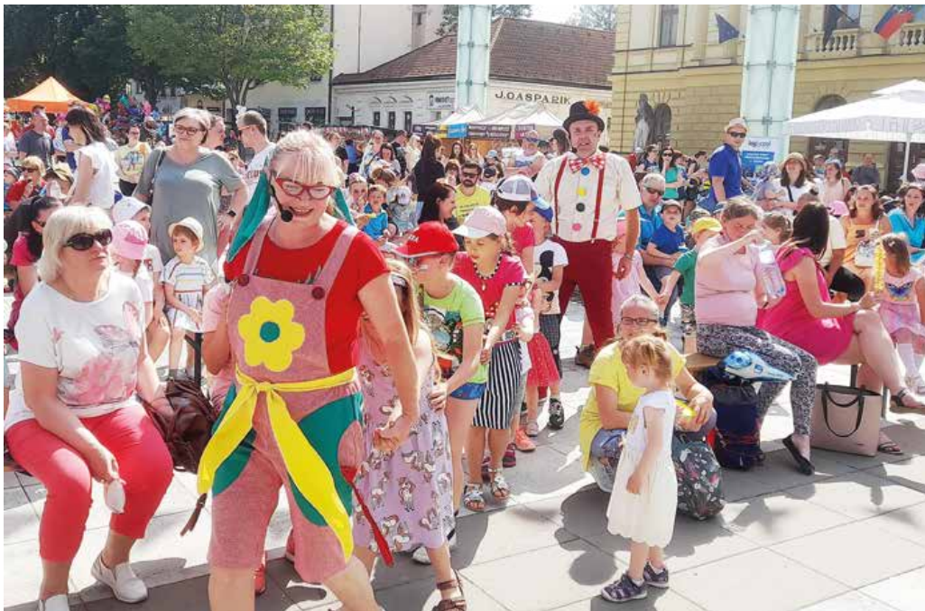
Zvedavka a kúzelník s martinskými deťmi vytvorili aj živý vláčik, ktorý jazdil po Divadelnom námestí.

Naše mesto od poslednej májovej soboty až po prvú júnovú žilo viacerými podujatiami, ktoré boli venované MDD. Decká si užili parádny program v Priekope, na Severe i v Záturčí a samozrejme aj v centre mesta na Divadelnom námestí. Každý si prišiel na svoje, na nudu vôbec nebol čas. A to ešte nie je všetko. V sobotu 10. júna sa pokračuje na Podháji od 10. h pri Požiarnej zbrojnici.