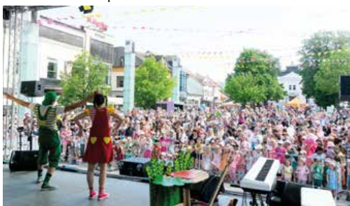
Na Deň detí bolo v meste plno.