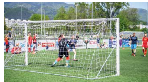
Dievčatá majú rady aj futbal.