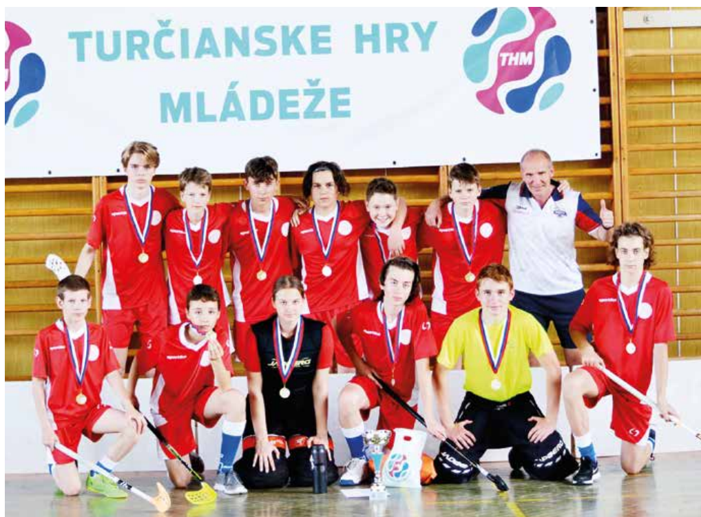
Prvý florbalový triumf pre KZŠ s MŠ Antona Bernoláka.

A. Bernoláka – N. Hejnej 2:0, Hurbanova 1:0, Krpeľany 7:2, Podhájska 1:0, Turany 6:0. Hurbanova – N. Hejnej 3:0, Krpeľany 2:0, Podhájska 2:1, Turany 1:0. Podhájska – N. Hejnej 3:1, Krpeľany 3:0, Turany 6:0. N. Hejnej – Krpeľany 2:1, Turany 1:2. Krpeľany – Turany 1:0. Roman Kopka