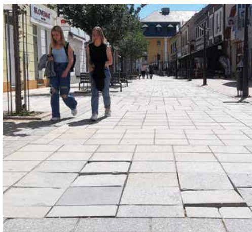
Na Ulici 29. augusta si tiež treba dávať pozor.

Stav dlažby v centre mesta je podľa jeho slov žalostný, na dennej báze dochádza k zakopnutiam, v horšom prípade k pádom a zraneniam. Radnicu požiadal o riešenie súčasnej zlej