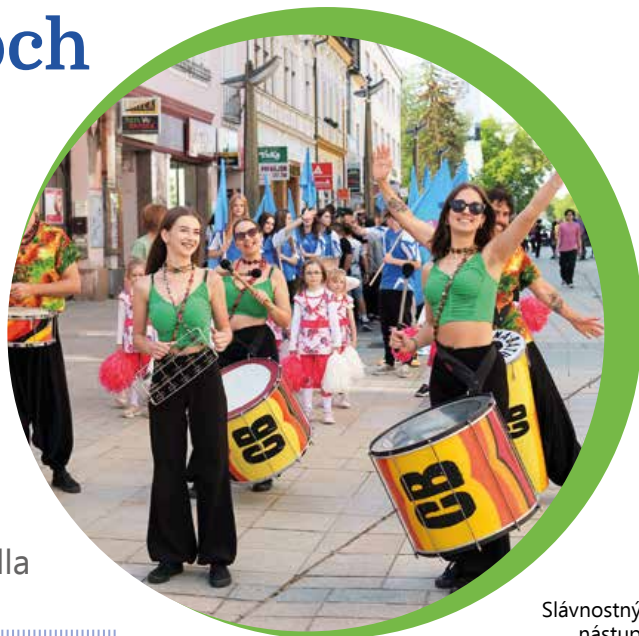
Slávnostný nástup na 60. ročník Turčianskych hier mládeže sa odohral v centre mesta Martin.

Turčianske hry mládeže oslávili počas predposledného májového týždňa (22. až 26. máj) jubilejnú šesťdesiatku. Sú najmasovejším podujatím tohto druhu nielen v Turci, ale aj na Slovensku a v ich bohatej histórii jej športoviskami prešlo viac ako 60-tisíc chlapcov a dievčat. Tento rok pribudla minimálne ďalšia tisícika.