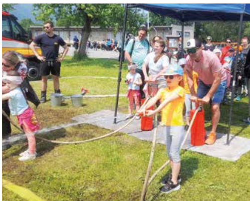
Tak takýto hasičský útok sa deťom rýchlo zapáčil. Pomáhali aj rodičia.