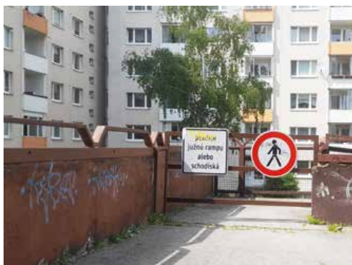
Prístupová rampa pešieho plató je na jeho severnej strane už dlhší čas uzavretá pre havarijný stav.

„Zo soli sa pod plató doslova tvorila „kvapľová jaskyňa“, aj preto sme na tento účel zabezpečili využívanie inertného materiálu. Aj tak sme ale spodné priestory museli z bezpečnostných dô-