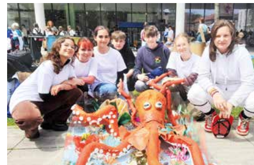
Chobotnica v akváriu je vítazný nápad školákov z Hurbanky.

a seniorky z domovov sociálnych služieb, ktorým bude kalendár venovaný.