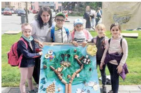
Vítazné dielo Strom života od žiakov II. B zo ZŠ na Ul. Jozefa Kronera.

Pútavé výtvy školákov neostanú pred verejnosťou schované, naopak, nájdú si ich zobrazené v pripravovanom kalendári. A potešia aj seniorov