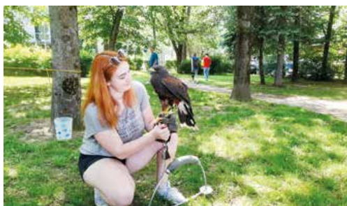
Na Severe sa deti dozvedeli aj niečo o jastraboch.