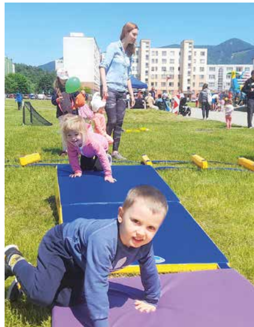
Zabaviť sa dalo na rôzne spôsoby, prekážková dráha v Záturčí.