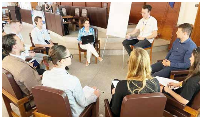
Jeden z workshopov bol zameraný na spoluprácu mesta s mladými ľuďmi.

Parlament mladých dáva o sebe čoraz viac vedieť. Pred pár dňami zorganizoval konferenciu o spájaní, na ktorej sa však otvorili aj mestské témy.