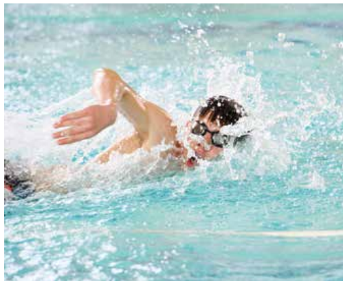
Plávanie je opäť silnou zložkou Turčianskych hier mládeže. Účasťou i výkonmi.