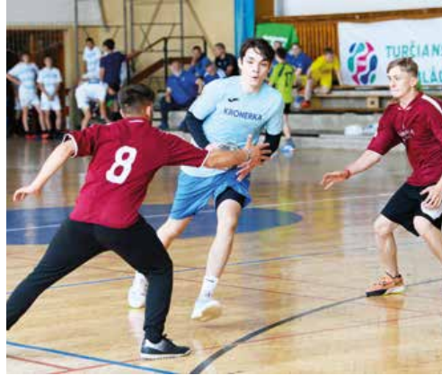
Aj hádzanársky turnaj chlapcov mal solídnu úroveň, prispeli k tomu aj chlapci z Kronerky.

Prvenstvo v hádzanej si vybojovali školáci z Jahodník, medzi dievčatami sa najviac darilo dievčatám z Evanjelickej spojenej školy.