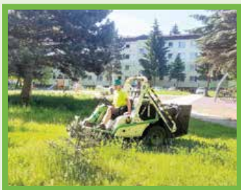
Začiatkom júna sa kosilo na Ľadovni.

Prvá kosba verejnej zelene bude po mestských častiach Stred, Ľadoveň-Jahodníky-Tomčany pokračovať v júni v mestských častiach Podháj-Stráne (9.–13. 6.), Záturčie (14.–15. 6.), Sever (16.–23. 6.) Košúty I a II (26.–29. 6.) a Priekopa (30. 6.–7. 7.).