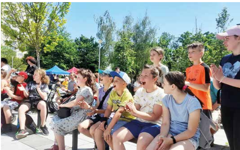
Decká zaplnili aj Námestie francúzskych partizánov na Severe.