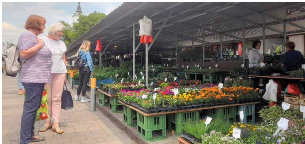
Takto to vyzeralo na tržnici koncom mája.