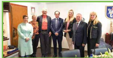
Martin začiatkom mája navštívila delegácia z islandského mesta Akureyri. Rodí sa nové partnerstvo.