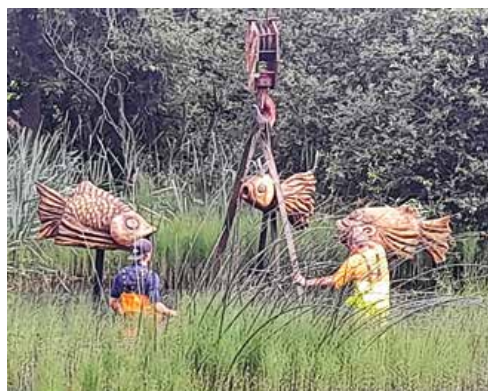
Ryby sa už týčia nad jazierom.