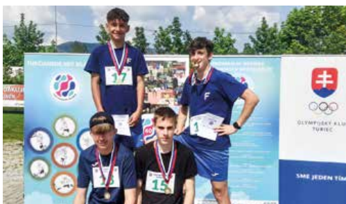
K medailovej žatve Hurbanky prispeli aj starší žiaci v štafetovom behu na 60 m.