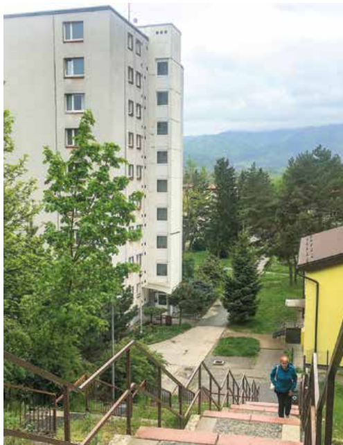
Martin disponuje prevažne starším bytovým fondom. Viac ako 80 percent bytov bolo vybudovaných pred rokom 2000.

Koľko bytov Martin potrebuje, aby zastavil pokles obyvateľstva? Ani na túto otázku nie je ľahké odpovedať, pretože do plánov výstavby vstupujú aj také kritériá, ako sú – sobášnosť, rozvodovosť, situácia na pracovnom a finančnom trhu, ale aj nároky na bývanie. Rastú napríklad vo veľkostnom i vybavenostnom štandarde. Do úvahy treba zobrať aj počet migrantov