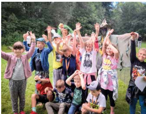
Jazerné bytosti, bahenný škriatok a víla vábnička si s deťmi rýchlo porozumeli.