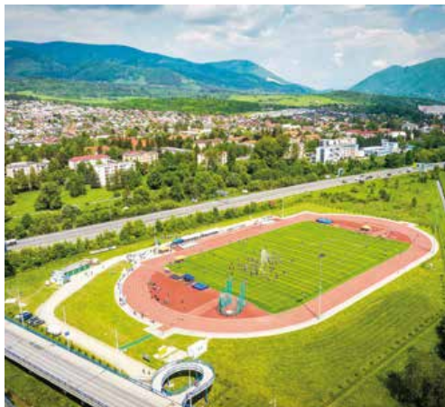
Atletický štadión je zatiaľ bez tribúny, no to sa v blízkej budúcnosti zmení.

Tribúna nebude určená len divákovi, v jej interiéri nájdu potrebné zázemie športovci, tréneri, rozhodcovia a aj organizátori športových podujatí.