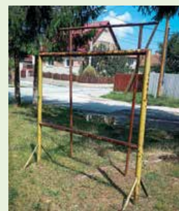
Staré a nevyužívané sušiaky by sa mohli po dohode so správcami domov demontovať.