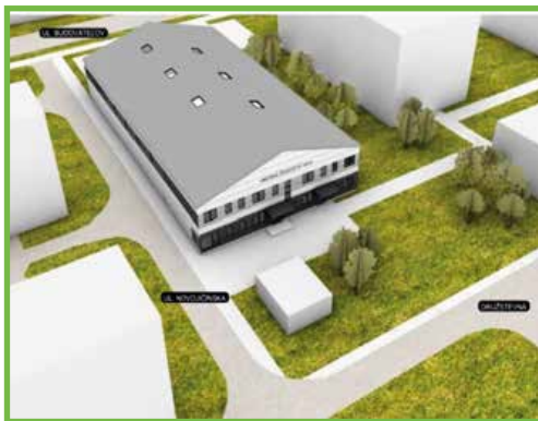
V multifunkčnej hale budú vytvorené podmienky pre viacero halových športov.

Charakteristika diela: Trojpodlažná multifunkčná športová hala predovšetkým pomôže