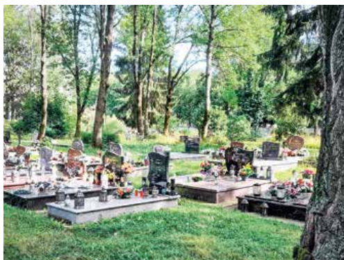
Jahodnícky cintorín.

„Rozšírili sme portfólio našich pracovných činností, na tento účel máme zatiaľ k dispozícii šiestich stabilných pracovníkov vrátane vedúceho pracovnej skupiny. V prípade potreby vieme náš tím posilniť o ďalších pracovníkov, ktorí sa primárne venujú pomocným stavebným