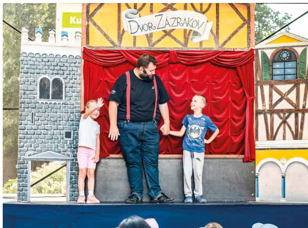
Deti potešila aj rozprávka o Jankovi a Marienke.

Program nájdú Martinčania a návštevníci mesta na plagátoch a webovej stránke Kultúrnej scény a mesta.