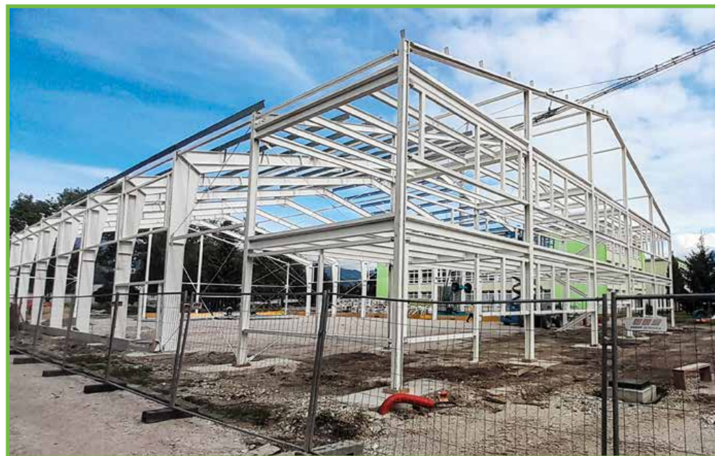
Na hlavnej budove sa už montuje oceľová konštrukcia.

Investícia: Hodnota diela je 2 419 999 eur. Dotácia vo výške 1,2 milióna eur poskytne ministerstvo investícií, regionálneho rozvoja a informatizácie, zvyšnú časť financií zabezpečilo mesto pomocou úveru, ktorý odsúhlasilo mestské zastupiteľstvo.