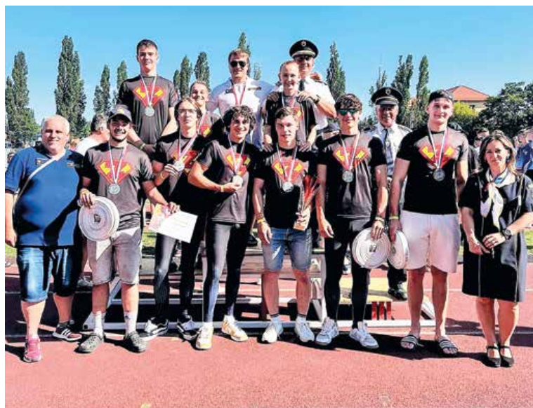
Úspešná partia dobrovoľných hasičov zo Záturčia.

„Určite sme prekvapili mnohých, a tak trochu aj seba. Na šampionát sme necestovali s medailovými ambíciami, veď už postup medzi najlepšiu slovenskú osmičku z krajských majstrovstiev sme vnímali ako úspech. Družstvo sa dalo dokopy len v tomto roku, no zásluhou kvalitnej prípravy, tímovej zohratosti i súdržnosti dokázalo veľa. Nepochybne ťažíme z dobrej práce so žiackymi družstvami, odkiaľ do dorastu prešli štyria borci a pomohli nám aj skúsenosti dvoch chalanov, ktorí sa napriek mladému veku nestratia ani medzi mužmi. Do kolektívu skvele