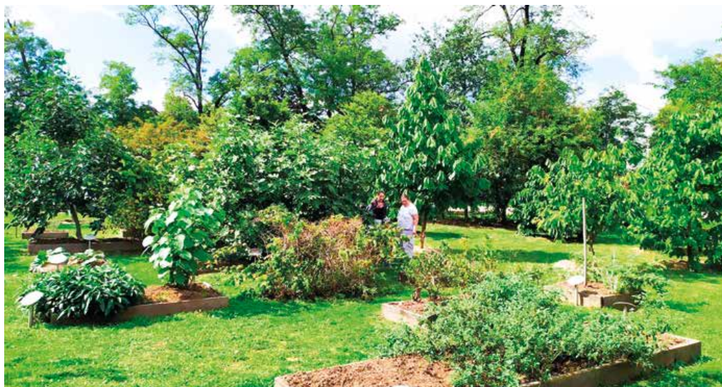
Komunitná záhrada.