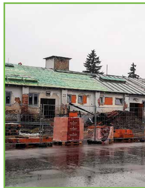
Zo starých nevyužitých skladov vznikne budova Envirocentra. So stavebnými úpravami sa začalo v máji.

Aktuálny stav: Stavenisko bolo odovzdané 16. mája tohto roku, keď sa aj začalo s realizačnými prácami. Kompletná rekonštrukcia objektu zahŕňa dispozičné zmeny, realizáciu nového sociálneho zázemia, výmenu strešnej krytiny, výmenu okenných a dverných výplní, zateplenie stavby a čiastočné odizolovanie spodnej stavby.