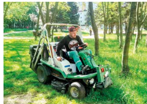
Starostlivosť a údržbu zelene v meste Martin bude mať naďalej na starosti firma Brantner Fatra.

V časti zabezpečenie čistenia šacht uličných vpustí, vsakov, žľabov, odtokov a iných šacht zvíťazila spoločnosť SEZAKO Trnava s ponukou vo