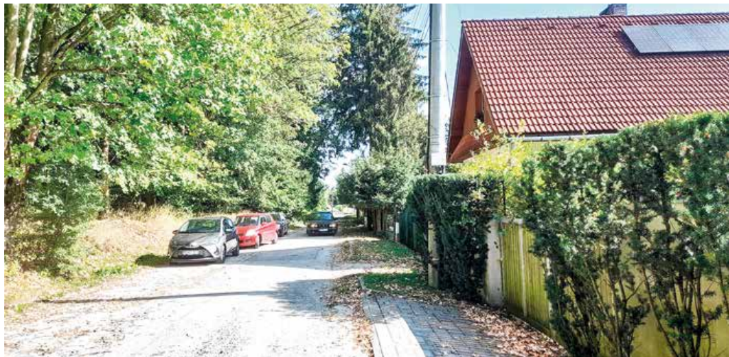
Horská ulica v Martine. Zasiahne ju stavebný ruch?

Obyvatelia z časti Stráne nesúhlasia s plánovanou výstavbou rodinných domov a rekreačných chat v priestore Horskej ulice. Prekáža im, že dôjde k výrubu stromov a poškodeniu ekologickej rovnováhy územia a stratia aj možnosť v blízkom lese sa rekreovať či športovo vyžívať. Proti výstavbe organizujú petíciu.