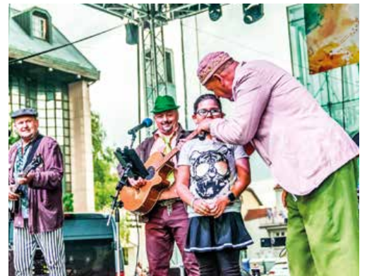
O tradičnú jarmočnú atmosféru sa postaral Drišľak.