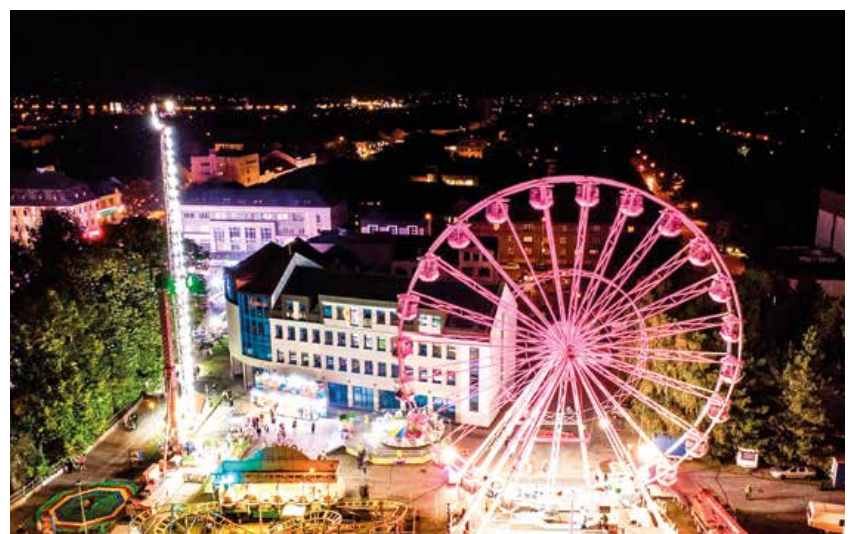
Aj tento rok sa medzi atrakcie jarmoku zaradilo vyhládkové kolo. Martin si ľudia pozreli z výšky 35 metrov.