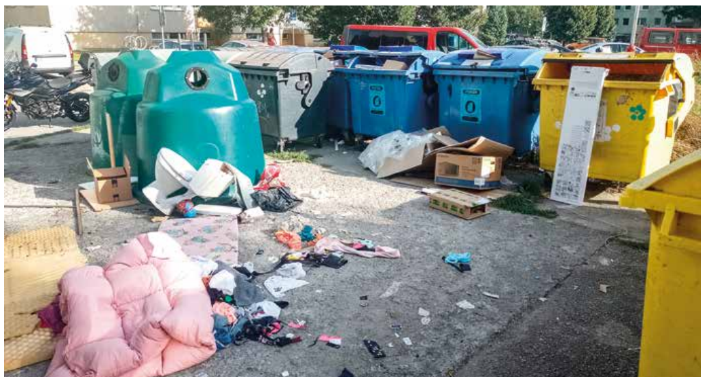
Takýto pohľad nikoho neteší.