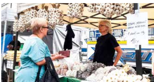
Zide sa do zásob na zimu – fazuľa, mak i cesnak.