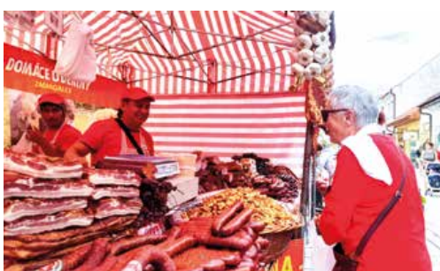
Tejto vóni údením nebolo jednoduché odolieť.