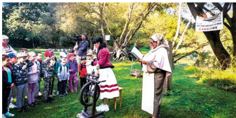
Rozprávka O zlatej priadke deti zaujala.

„Predstavili sme im dve slovenské rozprávky – O zlatej priadke a o Jankovi Hraškovi. Avšak predtým sme pri severnom vstupe na jazierko slávnostným zvončením, o čo sa postaral jazerný škriatok, otvorili novú zvonkohru. Verím, že sa bude všetkým páčiť. Určite poteší malých, ale aj veľkých. My sa úprimne tešíme z každej návšte-