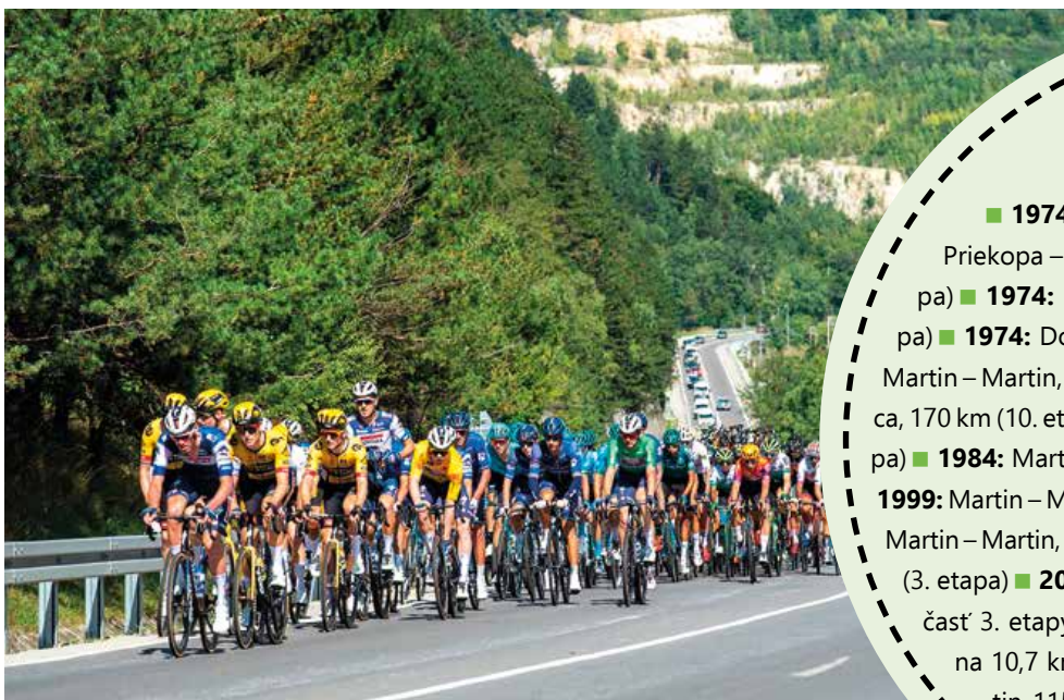
Tretia etapa pretekov Okolo Slovenska mala prívlastok kráľovská. ↑