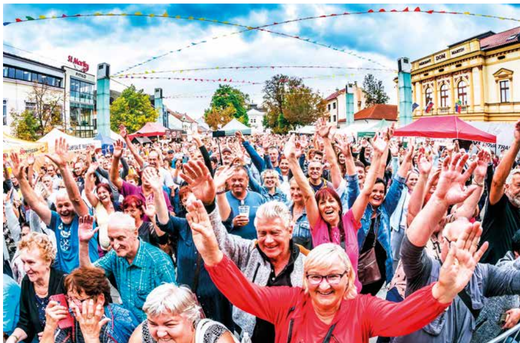
Aj takto parádne sa ľudia na tohtoročnom Martinskom jarmoku bavili.