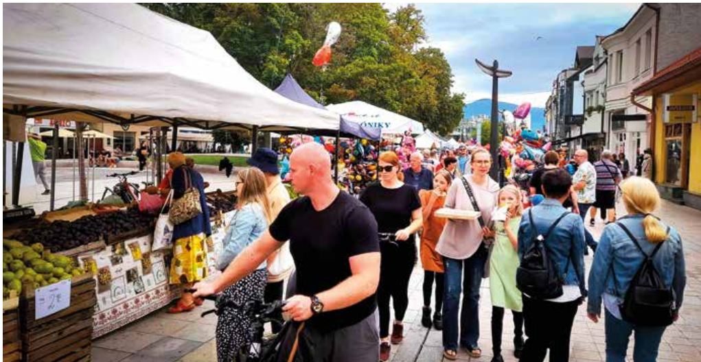
Pešia zóna v centre mesta sa zaplnila už od rána. Stánky lemovali veľkú časť Ulice M. R. Štefánika.