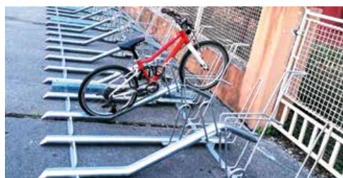
Cyklostojan pred budovou ZŠ na Ul. Pavla Mudroňa.

Je to zásluhou úspešného projektu mesta Martin na umiestnenie cyklostojanov ku základným školám. Martinská radnica projektom reagovala