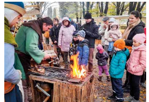
Ukážka remesiel z dávných čias, kováči nemohli chýbať.