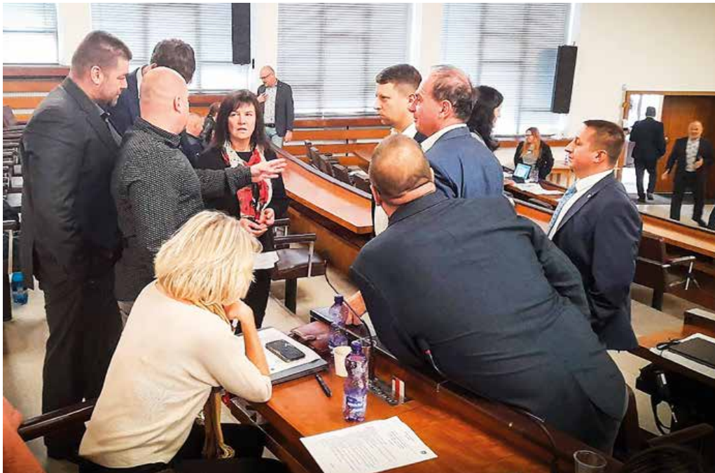
Počas dlhého rokovania sa bolo treba občas aj poradiť.