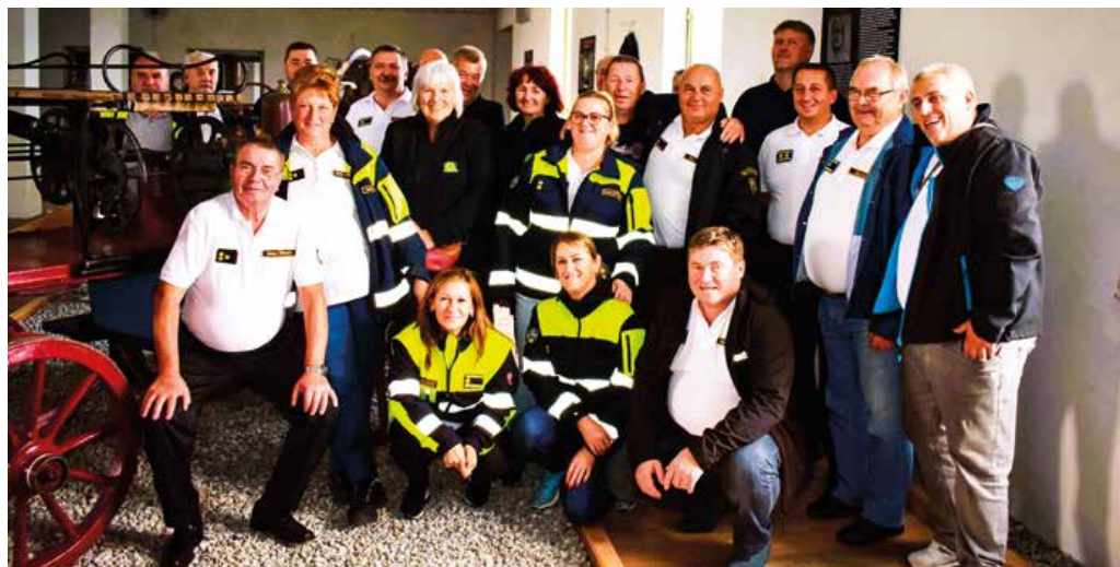
Na návšteve Hasičského múzea v Priekope.