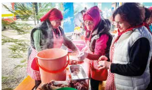
Šikovné gazdinky pri krájaní mäska z kapustnice.