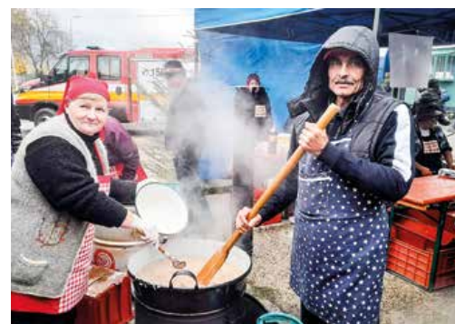
Na zabijačke v priekopskom SIM-e sa varila aj kapustnica.