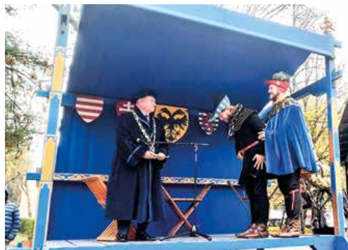
Primátor prevzal listinu od uhorského kráľa Karola Róberta, ktorý povýšil Martin na mesto.