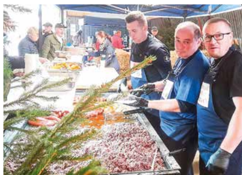
Dobrovoľní hasiči sa postarali o to, aby neboli ľudia hladní.