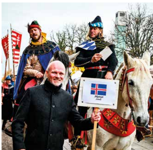
V Martine sa počas Svätomartinských dní dobre cítili aj naši noví priatelia z islandského mesta Akureyri.

Divadelné námestie opäť praskalo vo švíkoch pri hudobných vystúpeniach. K vrcholom kultúrnej časti určite patrilo hodinový piatkový koncert Jany Kirschner, rodáčky z Martina, na ktorú sa mnohí ľudia vyslovene tešili. O ľudovú zábavu sa deň predtým zas postarala legendárna skupina Lojzo so svojimi tradičnými hitmi. Priazeň mladšej generácie Martinčanov si užil aj rapper