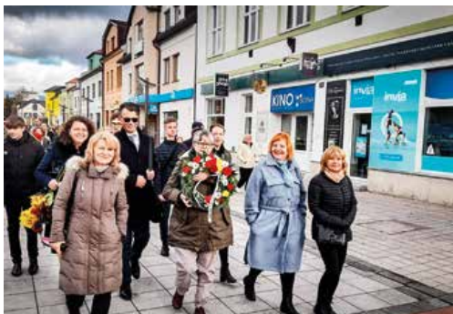
Sprievod počas Slávnosti bielej ruže sa presúva do Kostola sv. Martina.