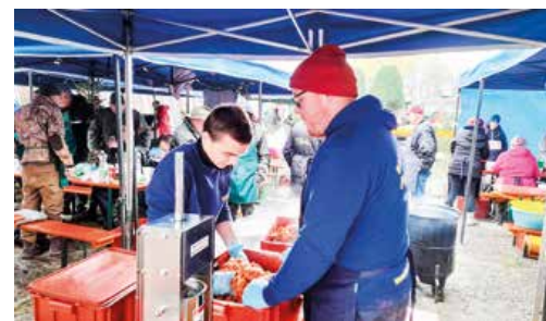
Ani mladá generácia sa nedala pri výrobe klobás zahanbiť.