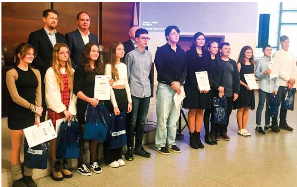
Fotografia hore: Defilé víťazov v kategórii literárnych prác a powerpointových prezentácií.