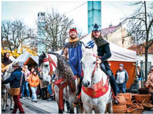
Martin sa sprievodom vrátil v čase.