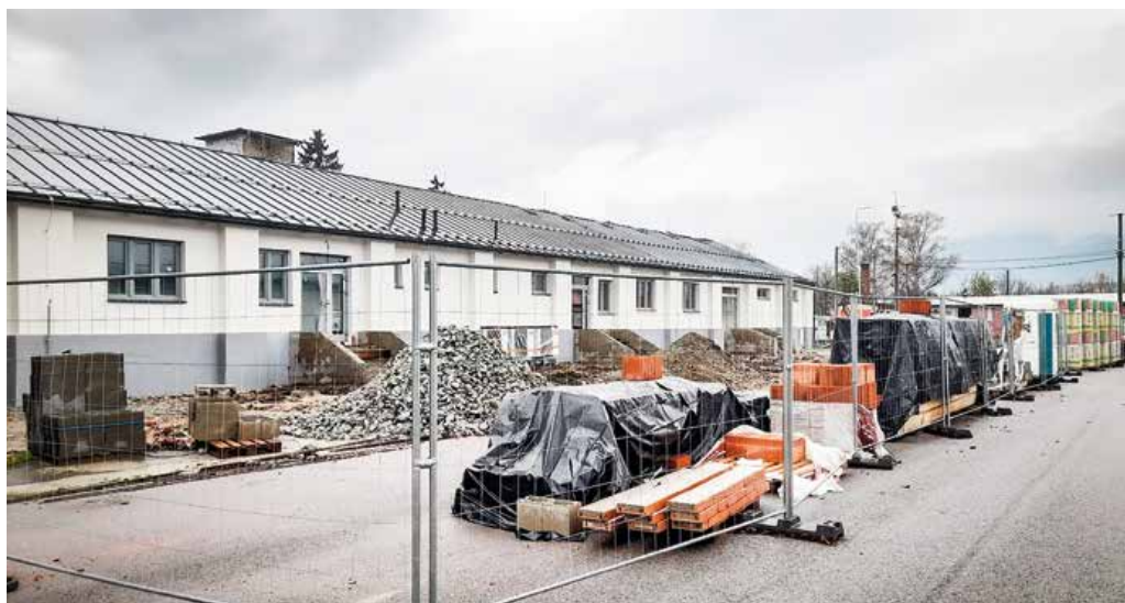
Staré vojenské sklady sa po rekonštrukcii zmenia na Envirocentrum.