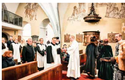
Ekumenické stretnutie v Kostole sv. Martina, kde si jeho účastníci uctili pamiatku Františka I. Révaya.