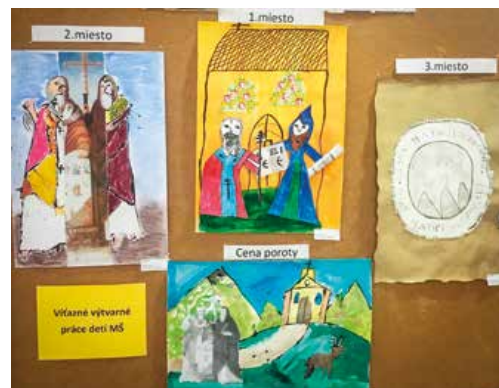
Fotografia dole: Z prezentácie výtvarných prác detí a žiakov, ktorých témou boli slávne kapitoly mesta Martin.