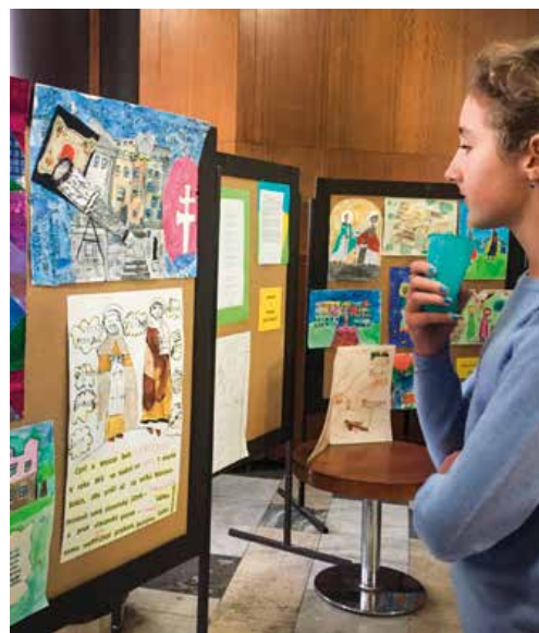
Takto vidia vierozvestcov najmenší Martinčania.