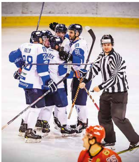
Najlepší zápas odohrali Martinčania proti Senici.

„Vzhľadom na všetky známe okolnosti sme s úvodom sezóny určite spokojní. Mužstvo, ktoré sa dalo dokopy len pred pár týždňami a stále sa nejakým spôsobom tvorí, odvádza solidnú prácu. Naozaj chcem chlapcom poďakovať, že popri svojich pracovných a rodinných povinnostiach berú túto súťaž vážne a záleží im na tom, aby sa martinský hokej opäť odrazil od