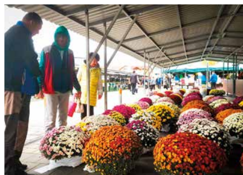
Počas jesennej sezóny zdobili trhovisko aj chryzantémy.

Martinské trhovisko pri nemocnici bolo v posledný októbrový deň plne obsadené. Akurát vrcholil predaj pestrofarebných chryzantém, nádherných ručne vyrobených vencov a kytíc, ktoré sme s láskou a vďačnosťou potom odniesli na hroby našich najbližších, aby sme si uctili ich pamiatku. Mnohých potešilo, že na rozdiel od predchádzajúcich rokov bolo v ponuke viac prírodných kytíc či vencov ako umelých. Tradične sa však predávalo aj ovocie so zeleninou a v plnej paráde fungovali i všetky prevádzky v ka-