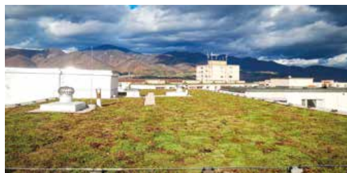
Prvá zelená strecha na obytnom dome v Martine.

„Na generálnu opravu strechy sme sa už dlhšie chystali, keďže do niektorých bytov zatekalo. No chceli sme ju mať inú, chceli sme ju mať