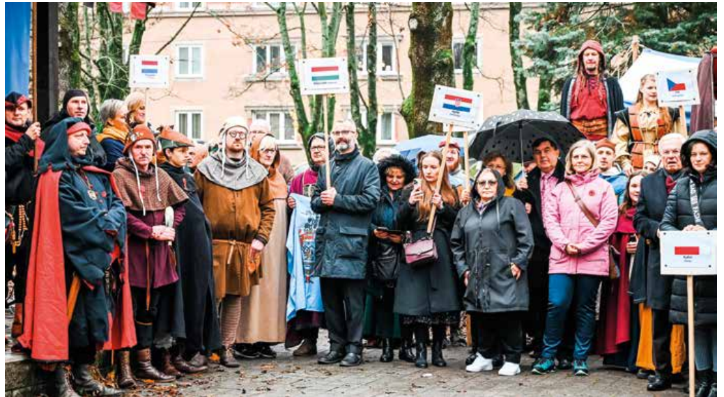
Aj delegácie z partnerských miest sa zapojili do stredovekých ceremónií.