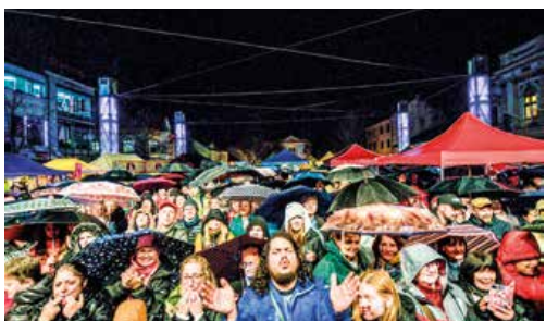
Martinčania sa aj napriek dažďu pri hudobných vystúpeniach dobre bavili.