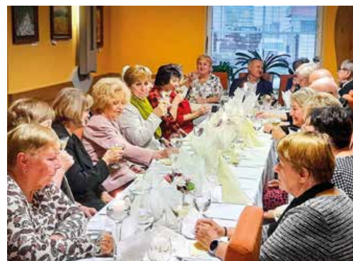
K množstvu gratulantov so želaním všetkého najlepšieho sa pripája aj naša redakcia.

Október je mesiacom úcty k starším a pri tejto príležitosti boli venované seniorom aj v meste Martin viaceré podujatia. Jedným z nich bolo aj tradičné spoločné posedenie jubilantov, ktoré v priestoroch reštaurácie Čierna pani pri slávnostnom obede zorganizoval Senior klub Martin.