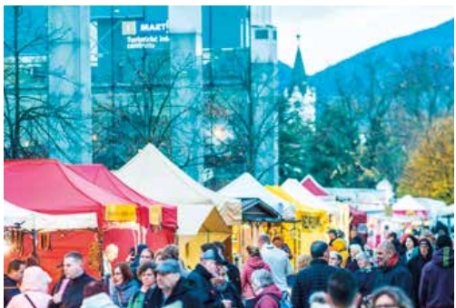
Súčasťou Svätomartinských dní je aj jarmok ľudových remesiel.