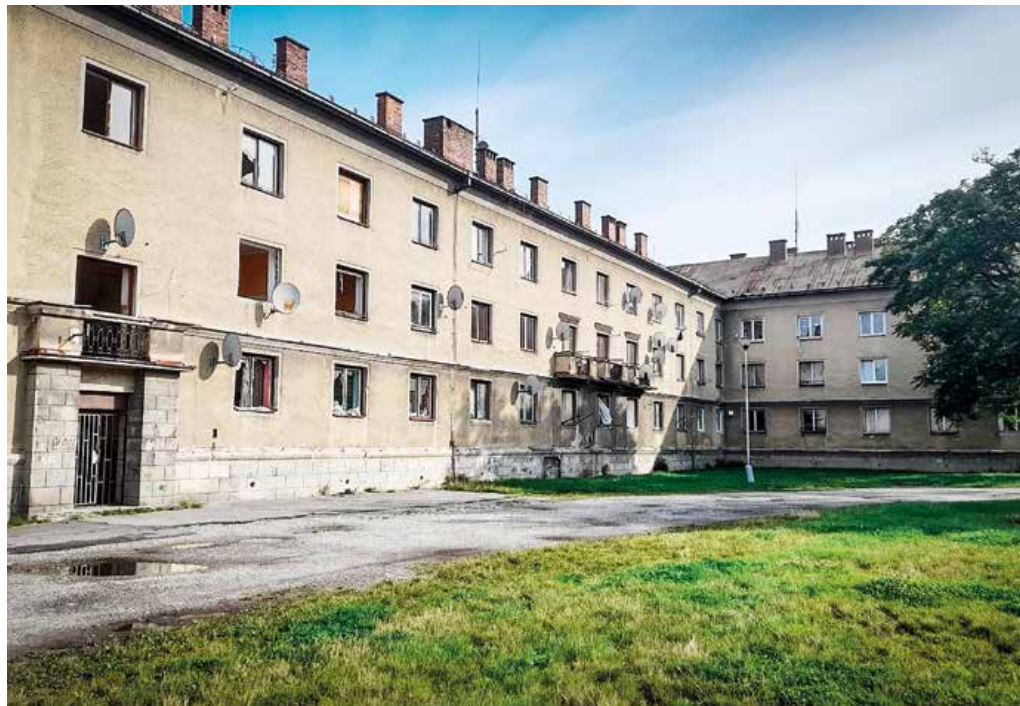
Časť peňazí z úveru sa použije aj na rekonštrukciu objektu na Uli. Ambra Pietra. Mesto jeho renováciou získa 48 nájomných bytov.

Päťmilionový úver sa splatí za 20 rokov s ročným úrokom 3,48 percenta. Táto fixná sadzba úroku platí po dobu desiatich rokov. Prvé splátky sú stanovené na rok 2025.