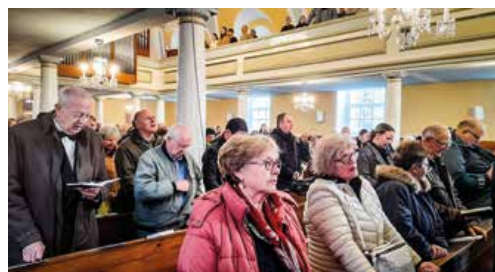
Slávnostné služby Božie v evanjelickom kostole v Martine.