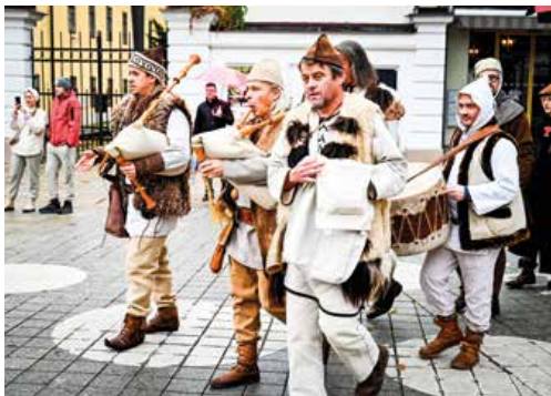
K historickému sprievodu patria aj doboví muzikanti.