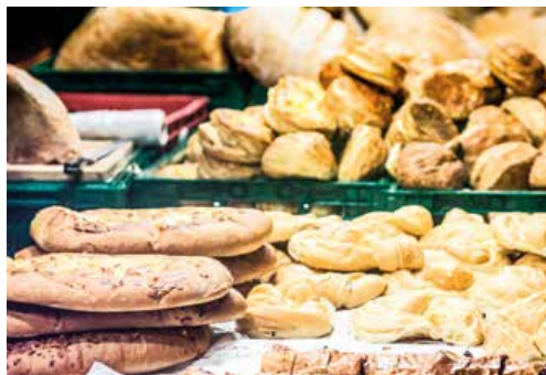
Aj niečo pod zub sa vždy na jarmoku nájde.