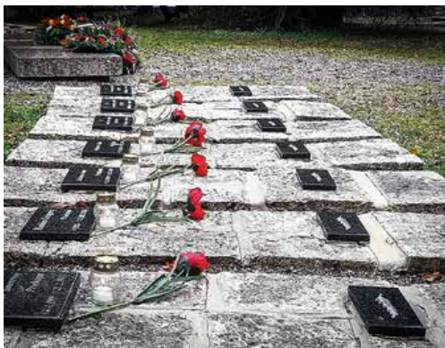
Mesto Martin si počas slávnostných chvíľ pripomenulo aj Deň vojnových veteránov.