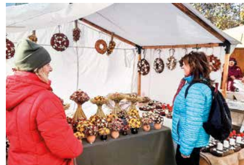
Niečo pre potešenie do vázy.