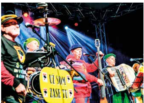
Na druhýkrát to už vyšlo, skupina Lojzo sa vie postarať o dobrú náladu.