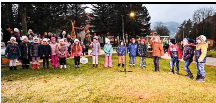
Zrevitalizovaný park na Námestí protifašistických bojovníkov je aj vhodným miestom na organizáciu rôznych komunitných podujatí.

program, v ktorom vystúpili deti z MŠ Podhájska. Pozitívne ohlasy malo aj podujatie k MDD v Okresnom riaditeľstve HaZZ na Podháji a tiež akcia venovaná očiste okolia rieky Turiec.