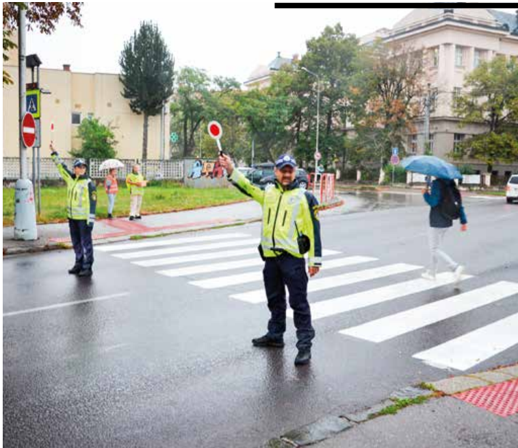
Mestskí policajti už viac ako 25 rokov pomáhajú pri bezpečnom dochádzaní žiakov do škôl.