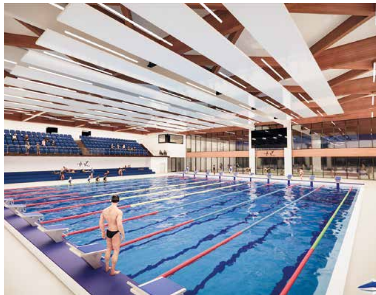
Národné centrum plaveckých športov by mohlo mať martinskú adresu.

Prebiehajú projektové práce spojené s technologickým vybavením tunela a následne sa začne s montážou samotnej technológie. Na trase sa realizujú posledné vrstvy konštrukcie vozovky, montujú sa protihlukové steny, záchytné a bezpečnostné zariadenia. Ukončenie stavby sa predpokladá koncom roka 2025. Zase je to posun v termíne, aj keď už len niekoľkomesačný.