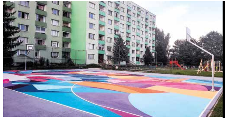
Vynovené basketbalové ihrisko si aj vďaka atraktívnemu vzhľadu rýchlo našlo svojich priaznivcov.

Academy. Tí nám pomohli aj s nastriekanim ďalšej plochy vo vnútrobloku na Ulici P. V. Rovnianka. Aj vďaka iniciatíve občianskeho združenia Turiec pre deti sme ďalšiu ošumelú asfaltovú plochu vo vnútrobloku na Gándhího ul. premenili na dopravné ihrisko. Dlhodobým problémom sídliska v Záturčí je stav pešieho plató. Dobrou správou je, že finišujeme s I. etapou jeho rekonštrukcie, ktorá sa týka opravy rampy a schodíšťa zo severnej strany, je treba ešte niektoré nedostatky odstrániť. Pokiaľ ide o detské ihriská, na niektorých z nich sme dopĺňali hracie prvky. No a v neposlednom rade sme buď sami alebo v spolupráci s občianskymi združeniami a hasičmi organizovali viacero