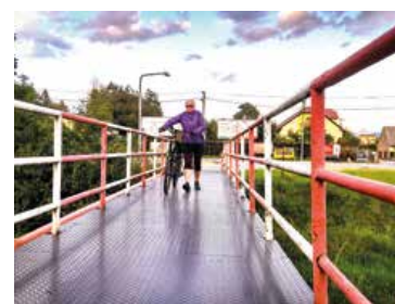
V Priekope vlani opravili mostík cez potok Jordán.