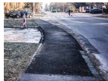
Niekoľko mesiacov museli obyvatelia Ľadovne obchádzať rozbitú časť chodníka pri jednotárskom supermarkete po frekventovanej ceste. Už nemusia.