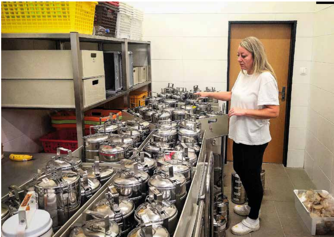
Súčasťou sociálnej politiky mesta Martin je aj varenie obedov pre seniorov a aj ich rozvoz do domácností.