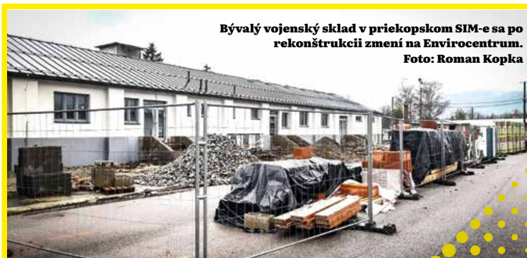
Bývalý vojenský sklad v priekopskom SIM-e sa po rekonštrukcii zmenil na Envirocentrum.

Na záver ešte dodajme, že mesto bude v roku 2024 finišovať s viacerými rozbehnutými investičnými akciami a plánuje sa venovať aj ďalším, čo však bude závisieť aj od úspešnosti získavania peňazí z mimorozpočtových zdrojov na rôzne projekty. O niektorých z nich informujeme aj v tomto vydaní Martinských novín. Roman Kopka