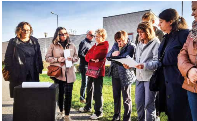
Obyvatelia diskutovali s poslancami o výsadbe zelene v priestore za Jantárom pri Kauflande. Prvá etapa by sa mohla začať už v tomto roku.

2 V roku 2024 budeme pokračovať v podpore dobrých nápadov a aktívnych komunít v Košútoch. Hneď na jar predstavíme úplne nový projekt zameraný na skrášľovanie Košút. Pokračovať budeme aj v podpore akcií v okolí jazierka. Časť podujatí sa však pokúsime vziať aj priamo do sídliska. Prvou lastovičkou