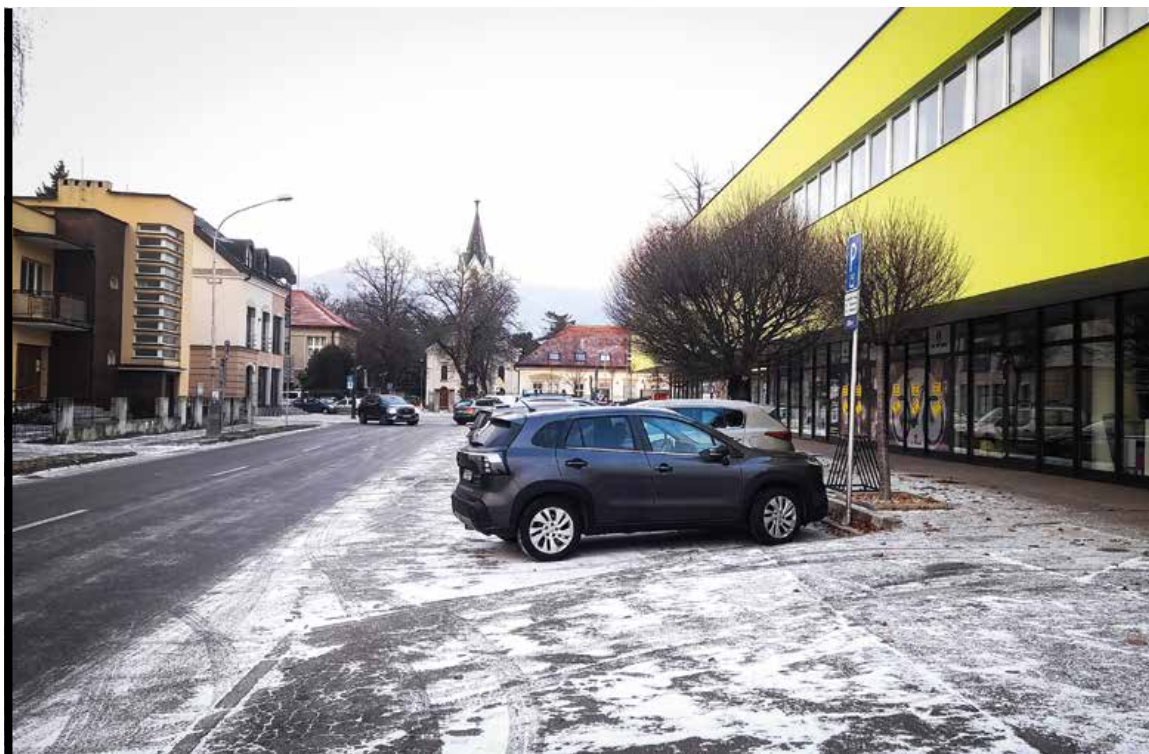
Spoločnosť Turiec, a. s., v tomto roku odšartuje proces zavádzania novej regulácie parkovania.

napríklad autobusom i vlakom. Pokročiť by sa malo aj v projektoch vybudovania vozovne, revitalizácie zastávok MHD vrátane osadenia elektronických informačných tabúľ. Pracuje sa aj na doplnení vozového parku, aktuálne prebieha súťaž na zakúpenie desiatich nových autobusov. Peniaze na tieto projekty chce DPMM získať z externých zdrojov.