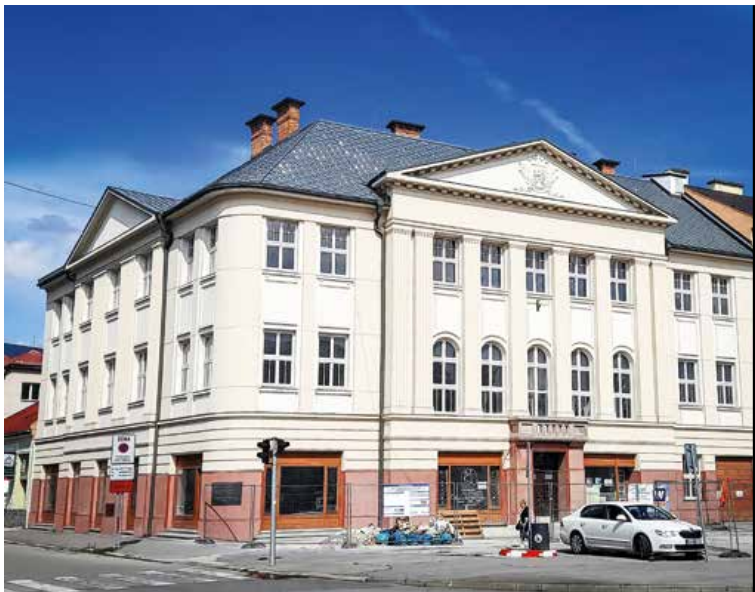
Mesto po rekonštrukcii tejto kultúrnej pamiatky získa nové reprezentačné priestory.