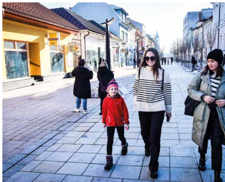
Mesto sa zapojí aj do projektu Digitálna demokracia.

po Ul. Nade Hejnej s napojením na štátnu cestu. Aktuálne je pri I. etape podaná žiadosť o vydanie územného rozhodnutia na príslušnom stavebnom úrade, pokiaľ ide o II. etapu, tak sa spracováva projektová dokumentácia pre územné rozhodnutie. Hotová by mala byť v polovici roka.