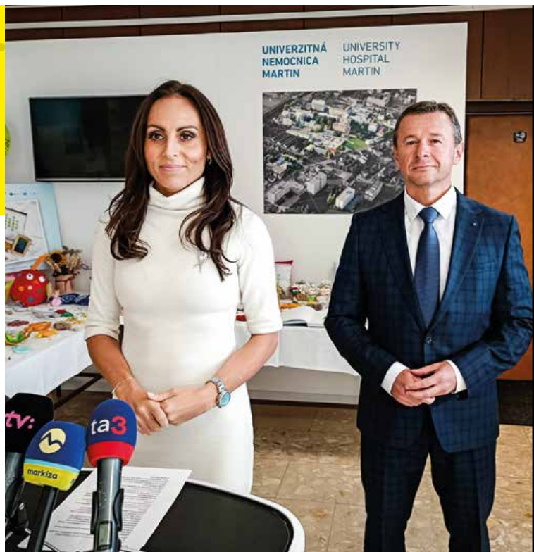
Ministerka zdravotníctva Zuzana Dolinková vymenovala do funkcie riaditeľa UNM Petra Durného.