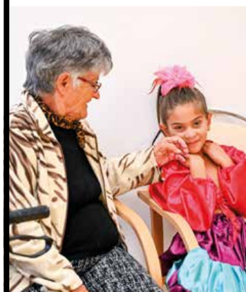
Počas vlaňajšieho októbra prišlo do centra viacero umeleckých kolektívov. Medzi nimi aj Fénix, zoskupenie, ktoré združuje deti z detských domovov.