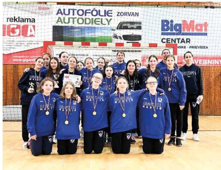
Dievčatá z Martina sa dokážu presadiť aj v medzinárodnej konkurencii.