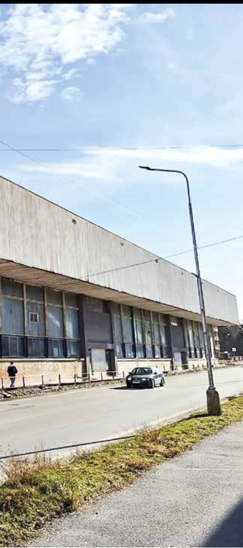
Zimný štadión v Martine na Podháji by potreboval komplexnú obnovu. V havarijnom stave je najmä strecha, jej oprava je nutná aj z hľadiska bezpečnosti.