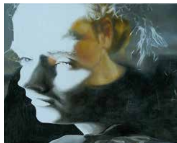
Ivona Žirková: Dvojportrét, 2003, Olej na konopnom plátne.

vo znevýhodnené skupiny, ale aj pre skupiny používateľov s vývinovými poruchami učenia a seniorov.