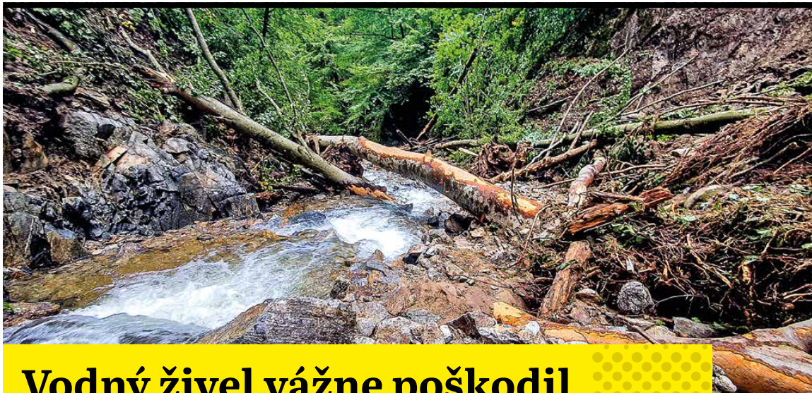
Vodný živel ferratu na Martinské hole vážne poškodil, koryto potoka na niektorých častiach zmenilo svoju trasu.