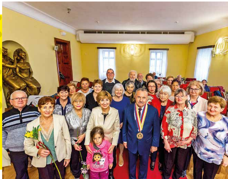
Martinskí jubilanti sa pozvanie od mesta potešili.

Mnohé dámy sa netajili tým, že ich pozvanie na slávnosť zahrialo pri srdiečku, no spokojní boli aj páni. Všetci boli radi, že sa na nich ani vo vyššom veku nezabúda.