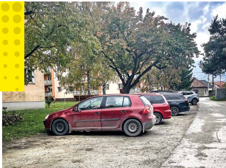
VMČ Podháj-Stráne aktuálne rieši aj renováciu parkovísk.

Bezpečnejšie, krajšie a funkčnejšie okolie pre deti, rodičov aj obyvateľov na Podháj – to je základná motivácia pre nové parkoviská v mestskej časti.