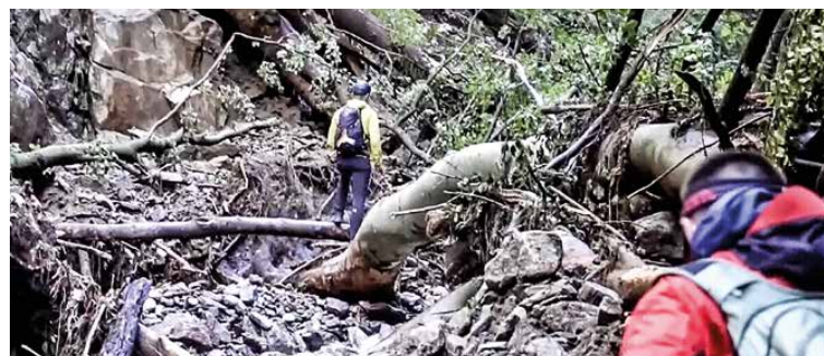
Predbežné škody boli vyčíslené na 20-tisíc eur.