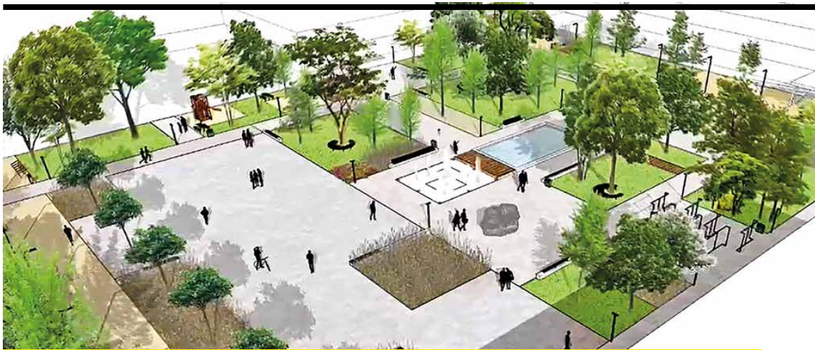
Vizualizácia zrevitalizovaného Námestia S. H. Vajanského.