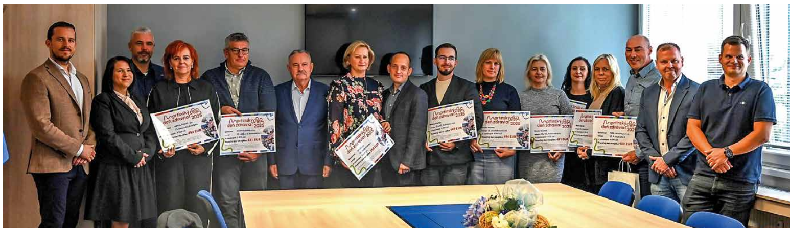
Za podané výkony si školy odmenu zaslúžili.