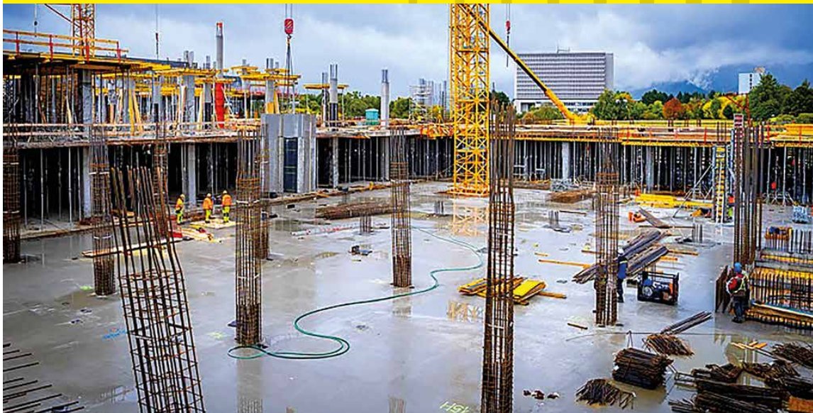
Stavba novej martinskej nemocnice napreduje zatiaľ podľa plánu.

Už o deväť mesiacov, v júni 2026, má byť dokončená hrubá stavba nemocnice. Prví pacienti by jej služby mali využiť na začiatku roku 2029.