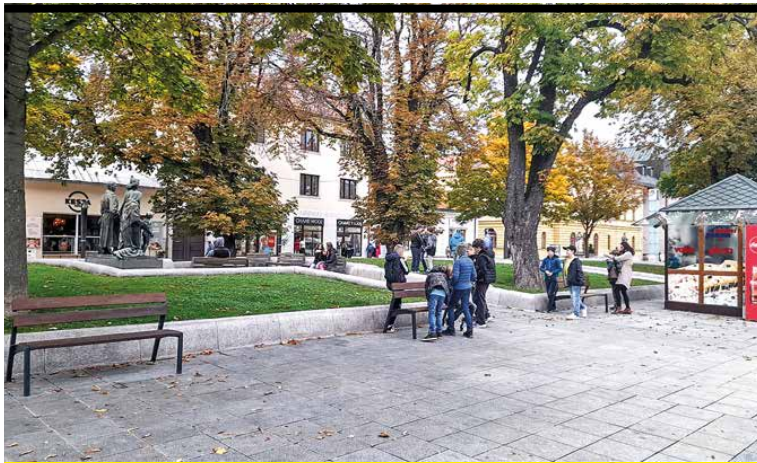
Do pešej zóny boli doplnené lavičky z Hviezdoslavovho parku.