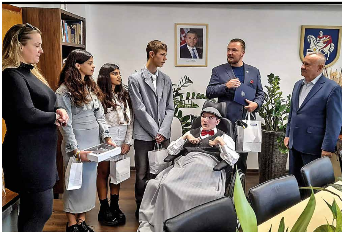
Priateľské stretnutie na radnici.

školy, vzťahov a budúcej práce," dodáva M. Michalec.