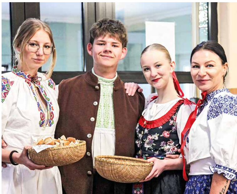
Pri vstupe do školy sa žiaci vítali chlebom a soľou.