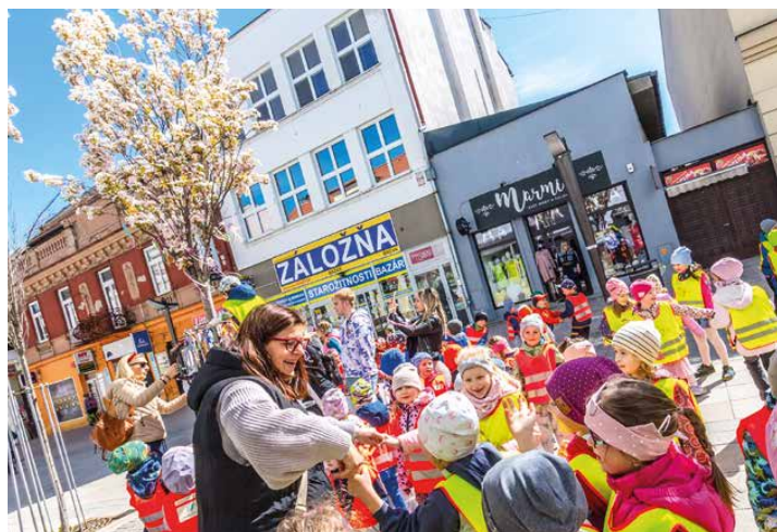
Takto stromy na pešej zóne vyzdobili deti z materských a základných škôl.