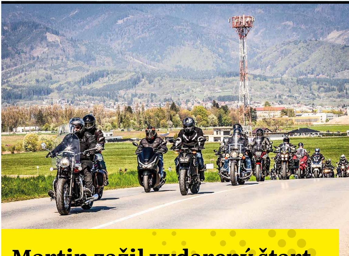
Motorkáři na ceste z Martina smerom na Dražkovce.