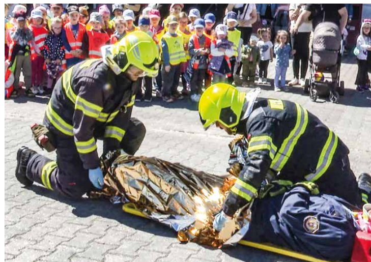
Ukážka zo zásahu hasičov – vyslobodenie vodiča z havarovaného auta.

„Vonku máme pripravené ukážky lezeckej skupiny. Bude prebiehať záchrana lezca, ktorý ostal uviaznutý na lane, takisto zlaňovanie z tretieho poschodia veže. Ďalej máme vyslobodzovanie havarovaných vozidiel, ktoré má na starosti naša športová skupina. Súčasťou programu je aj hasenie horiacej kvapaliny,“ pokračo-