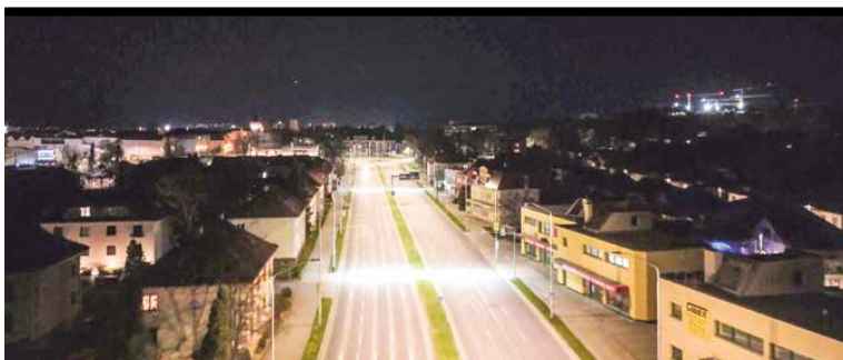
Takto svietia nové svetlá na Jesenského ulici.

Na každej lampe je štítok s QR kódom, pomocou ktorého možno nahlasovať poruchy. Je tam uvedené aj telefónne číslo správcu.