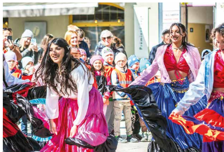
Umelecké zoskupenie Fénix v akcii.