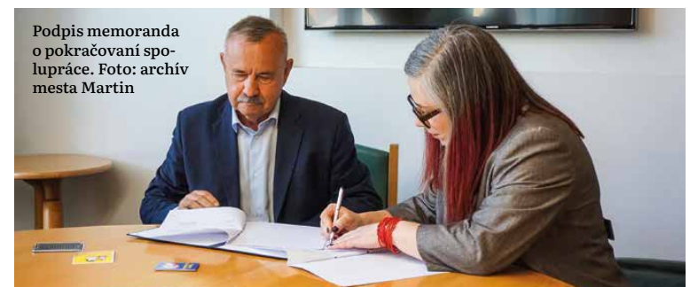
Podpis memoranda o pokračovaní spolupráce.