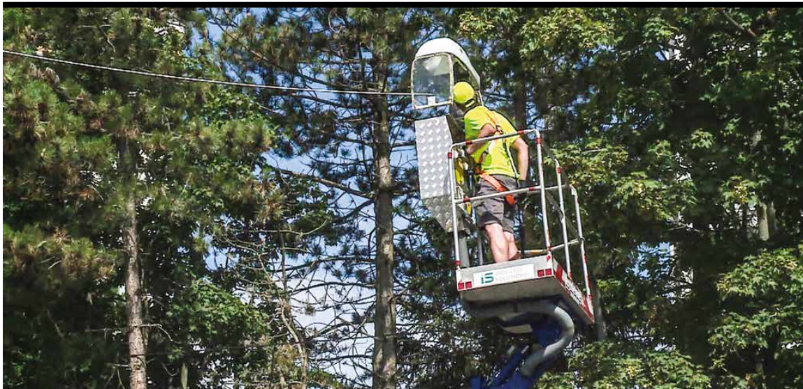
Na Ladovni svietidlá menili v lete.