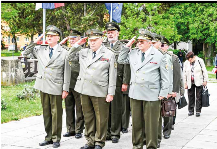
Pietny akt kladenia vencov pri Pamätníku SNP v Martine na Severe.