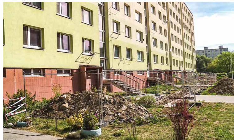
Staré rozvody sa budú meniť aj na Ulici Matúša Dulu.

Rekonštrukcia a obnova chodníkov budú stáť viac ako 900-tisíc eur. Dobrou správou je, že 85 percent nákladov