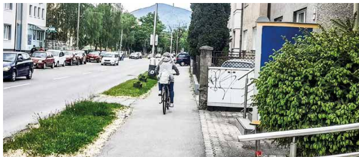
Na tejto ulici chcú vysadiť kríky.